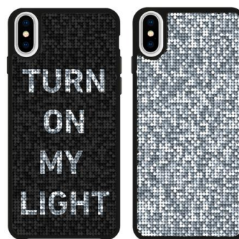
DOUBLE FACE CASE